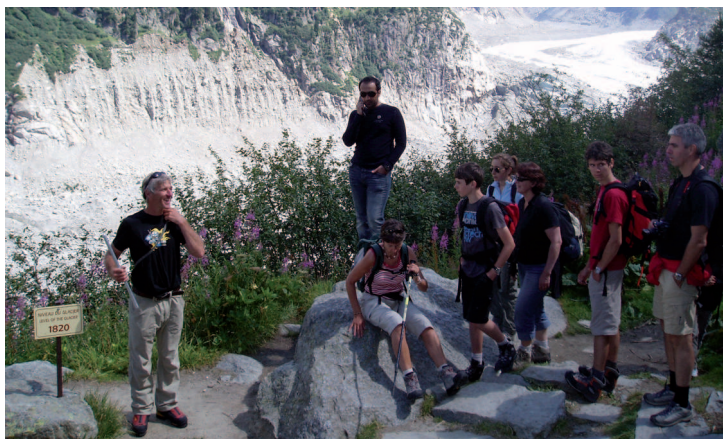
Site du Montenvers

Le musée à ciel ouvert est un élément complémentaire et intermédiaire entre le « guide papier » et la visite guidée par des professionnels (Accompagnateurs en Montagne, guides du patrimoine, moniteurs et guides de haute-montagne) et s'appuie sur les scientifiques des différentes disciplines, installés dans la vallée et constitués en « réseau des acteurs de la connaissance » .