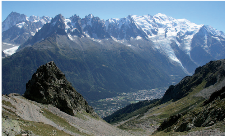
Vallée de Chamonix-Mont-Blanc

Le musée à ciel ouvert est un élément complémentaire et intermédiaire entre le « guide papier » et la visite guidée par des professionnels (Accompagnateurs en Montagne, guides du patrimoine, moniteurs et guides de haute-montagne) et s'appuie sur les scientifiques des différentes disciplines, installés dans la vallée et constitués en « réseau des acteurs de la connaissance » .